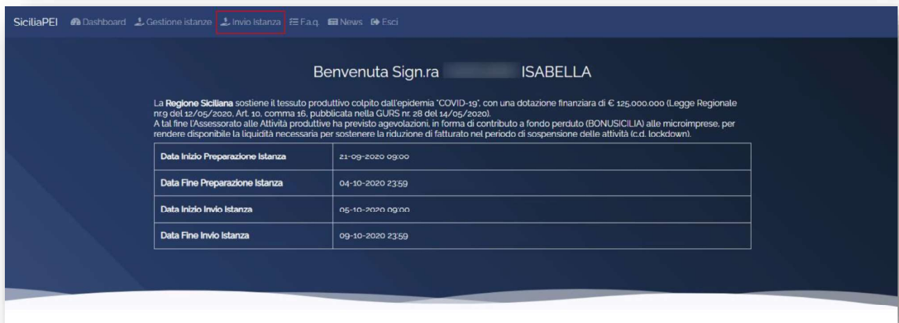
Figura 22 - Dashboard - Voce di Menù Invio Istanza

Dalla data di apertura della Fase di invio, prevista il 05/10/2020 dalle ore 09.00, a valle dell'accesso a mezzo SPID, nell'area riservata sarà disponibile la voce di menu "Invio Istanza" che consente agli utenti che hanno completato con successo la precedente fase di preparazione di presentare l'istanza/le istanze di interesse.